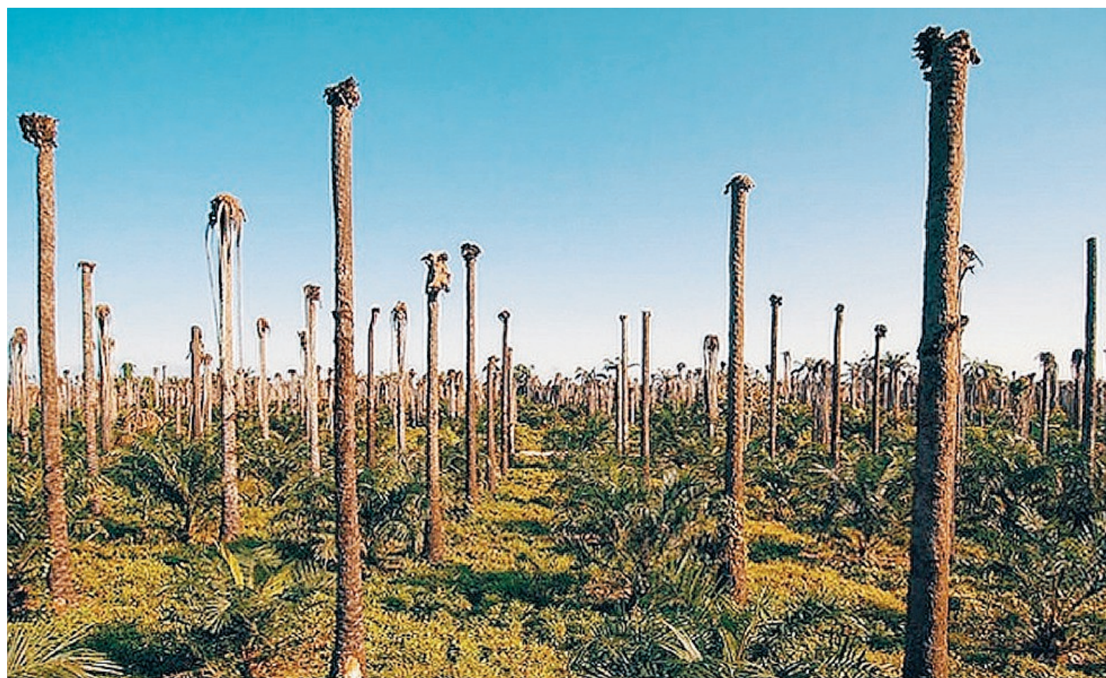
Cinema. «Abre los ojos» (Apri gli occhi), un invito a guardarsi intorno e riflettere sui temi ambientali

● Sono tutte testimonianze di istituzioni religiose, medioevali e moderne di Palermo, chiese e siti oggi tutelati e custoditi dal Fondo Edifici di Culto del Ministero dell'Interno. E proprio dalla collaborazione tra il Fec e il museo regionale, nasce «Eredità d'arte» curata da Evelina De Castro, nella Sala del Sottocoro dell'Abatellis. Dai cosiddetti «fondi oro» medioevali, al Rinascimento toscano di Della Robbia, al Barocco. Alcune delle opere vengono presentate per la prima volta.